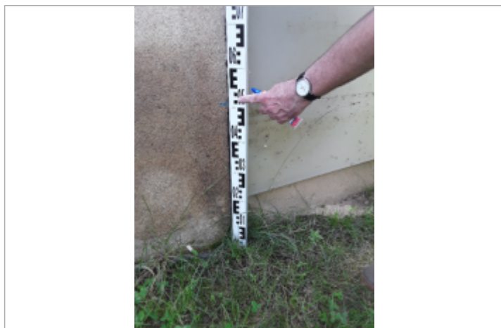
photo du repère de près