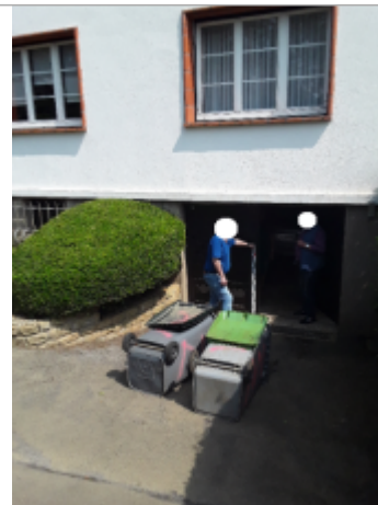
photo du repère de loin