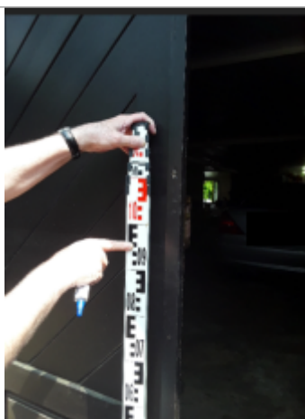
photo du repère de près