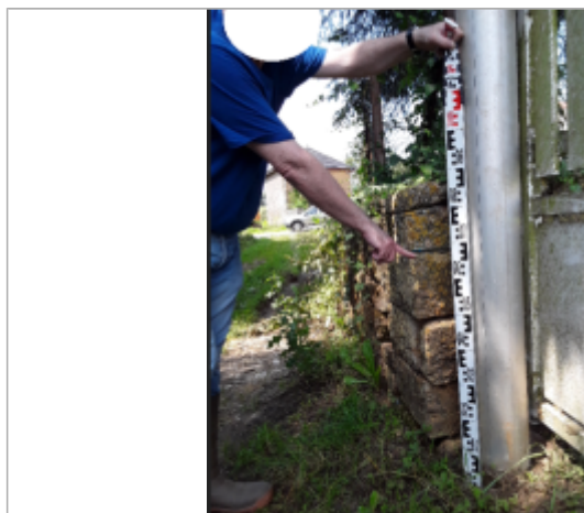
photo du repère de près