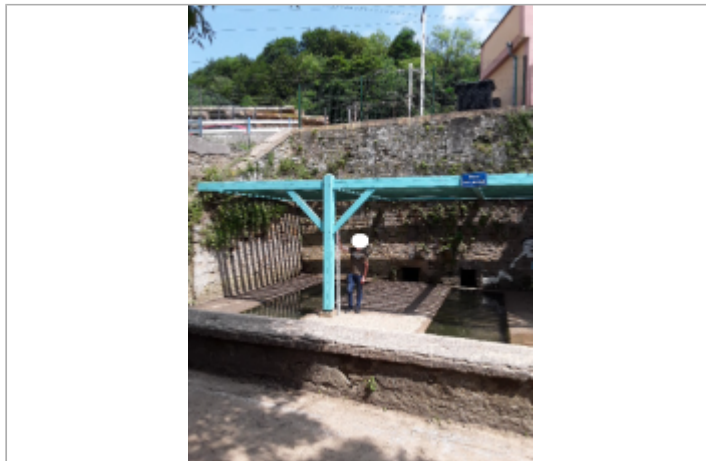
photo du repère de loin

Coordonnées WGS84 : X: 5.60296000 / Y: 49.44676000