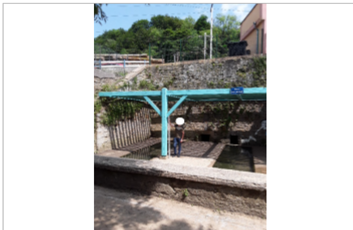
photo du repère de loin