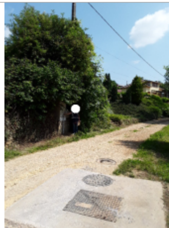
photo du repère de loin