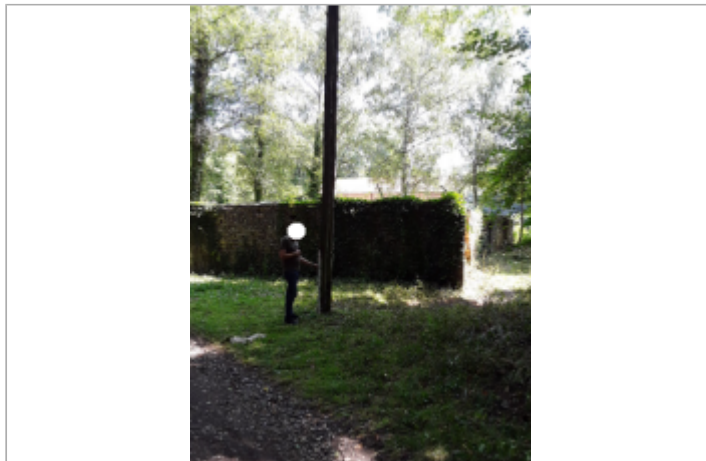
photo du repère de loin