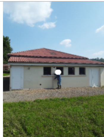
photo du repère de loin