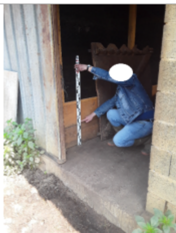
photo du repère de près

SOURCE DE REPÉRAGE : DDT MEURTHE-ET-MOSELLE - 23/07/2021