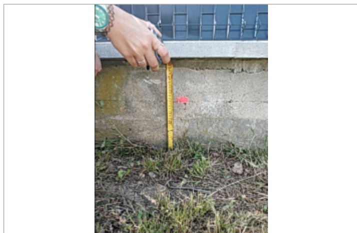
photo du repère de près