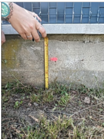
photo du repère de près