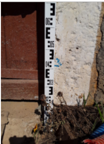
photo du repère de près