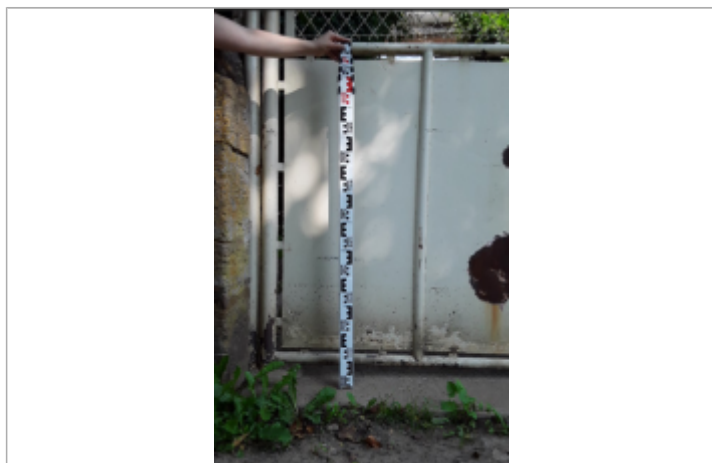
photo du repère de près