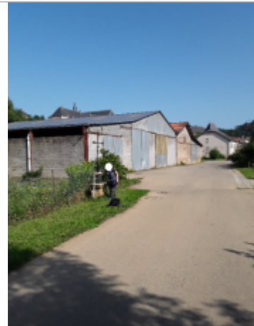
photo du repère de loin

Coordonnées WGS84 : X: 5.70247000 / Y: 49.48160000