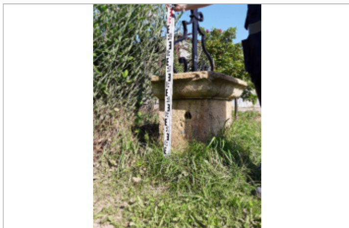
photo du repère de près