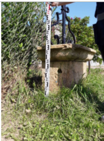
photo du repère de près

Altitude calculée de l'eau (en m) : 236.99