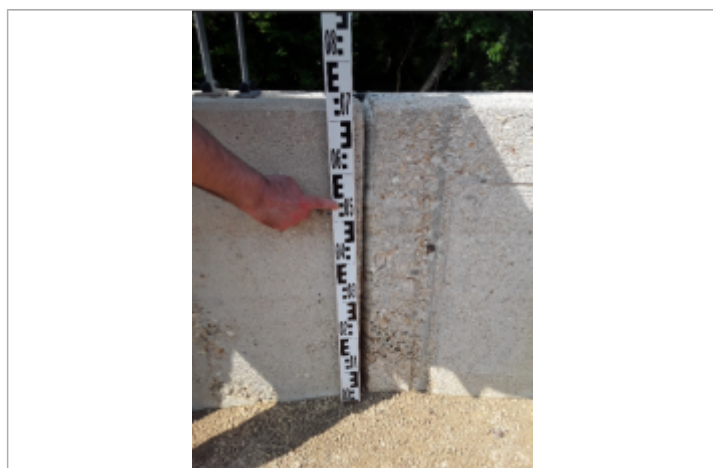
photo du repère de près