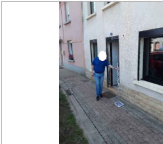
photo du repère de loin

Coordonnées WGS84 : X: 5.51137600 / Y: 49.48359300