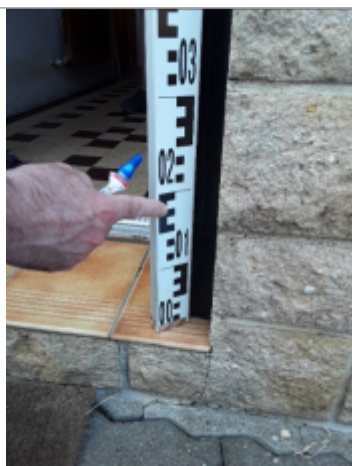
photo du repère de près

Altitude calculée de l'eau (en m) : 196.88