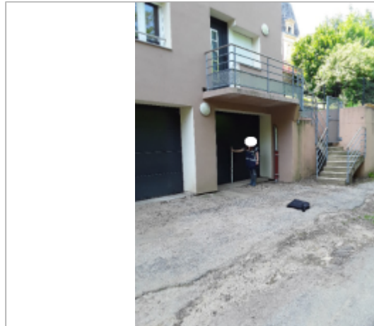
photo du repère de loin

Coordonnées WGS84 : X: 5.75478000 / Y: 49.50389000