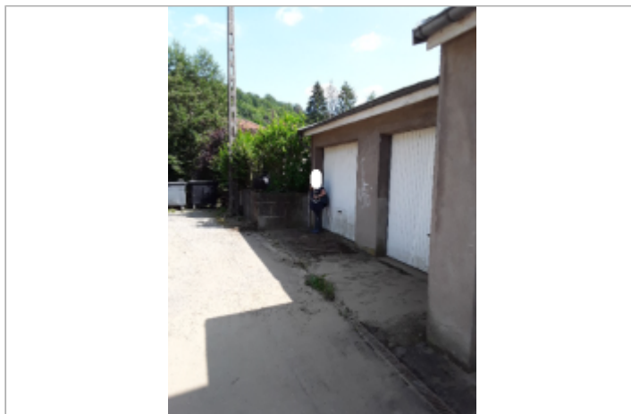
photo du repère de loin