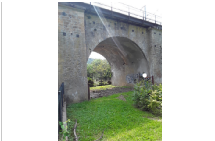
photo du repère de loin