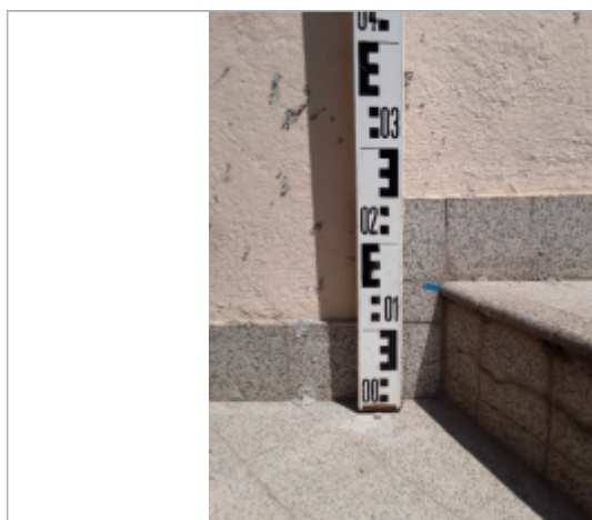
photo du repère de près