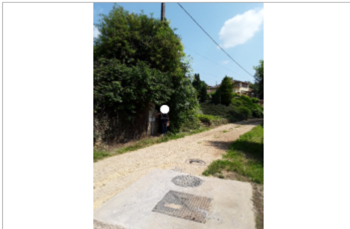
photo du repère de loin