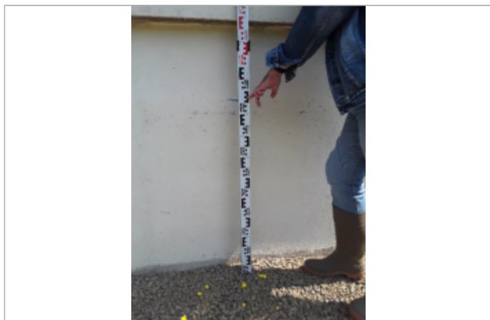
photo du repère de près

SOURCE DE REPÉRAGE : DDT MEURTHE-ET-MOSELLE - 23/07/2021