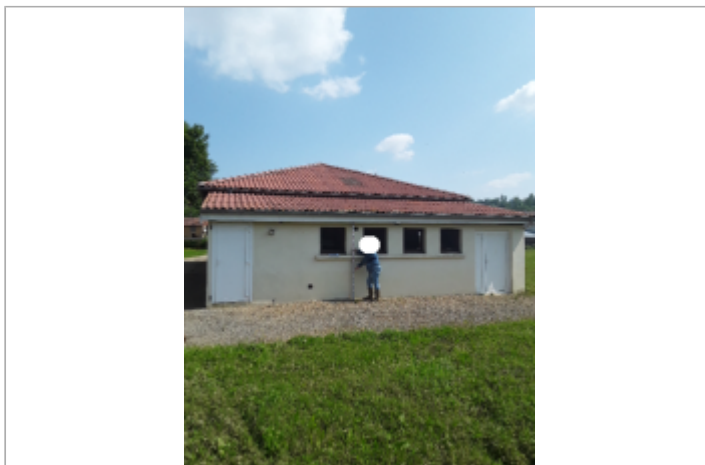
photo du repère de loin