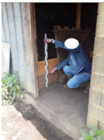
photo du repère de près