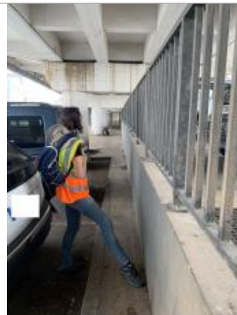
Vue d'ensemble de la zone inondée

Coordonnées RGF93 (ETRS89) : X: -61.7316577 / Y: 15.9954044