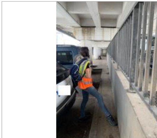
Vue d'ensemble de la zone inondée

Coordonnées WGS84 : X: -61.73165770 / Y: 15.99540440