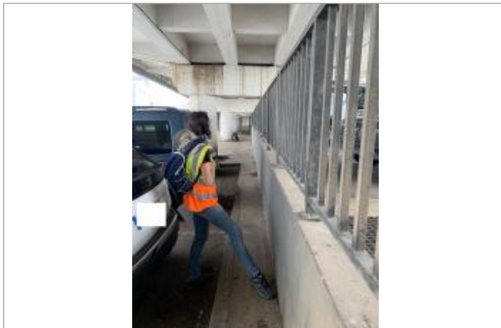
Vue d'ensemble de la zone inondée