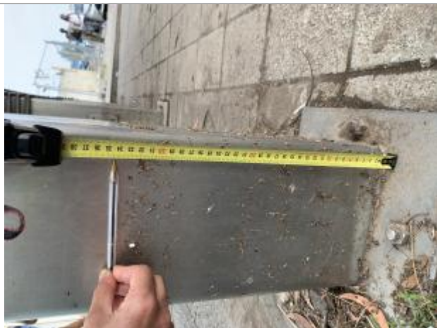
Dépôt de matières solides