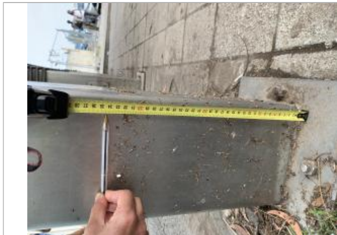
Dépôt de matières solides

Altitude calculée de l'eau (en m) : 2.801