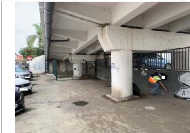
Vue d'ensemble de la hauteur d'eau atteinte