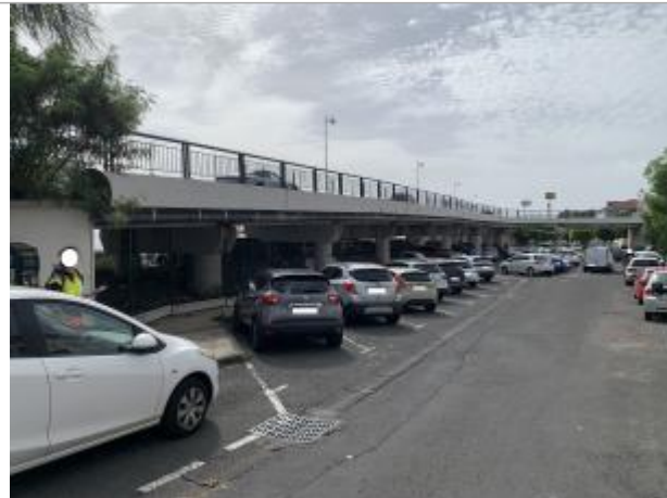
Vue d'ensemble de la zone inondée à partir de la plaque d'égout