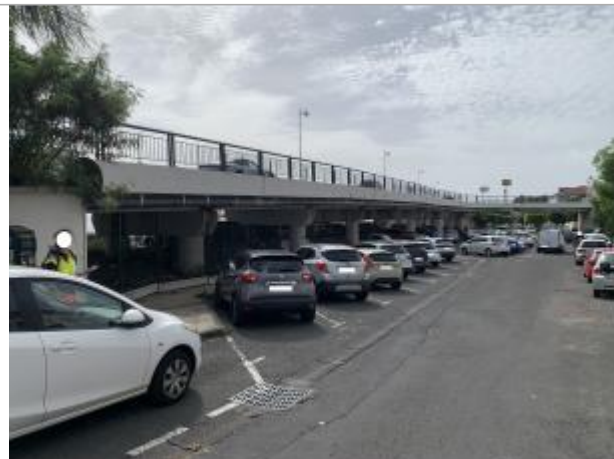
Vue d'ensemble de la zone inondée à partir de la plaque d'égout