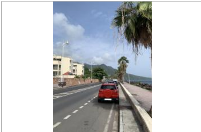
Vue d'ensemble de la zone inondée