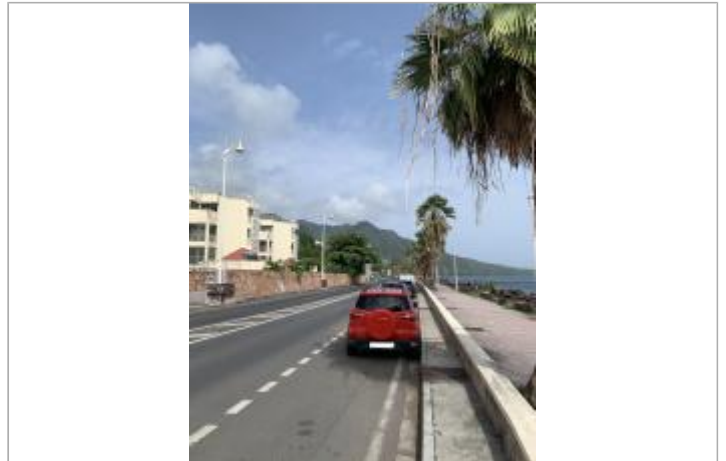
Vue d'ensemble de la zone inondée