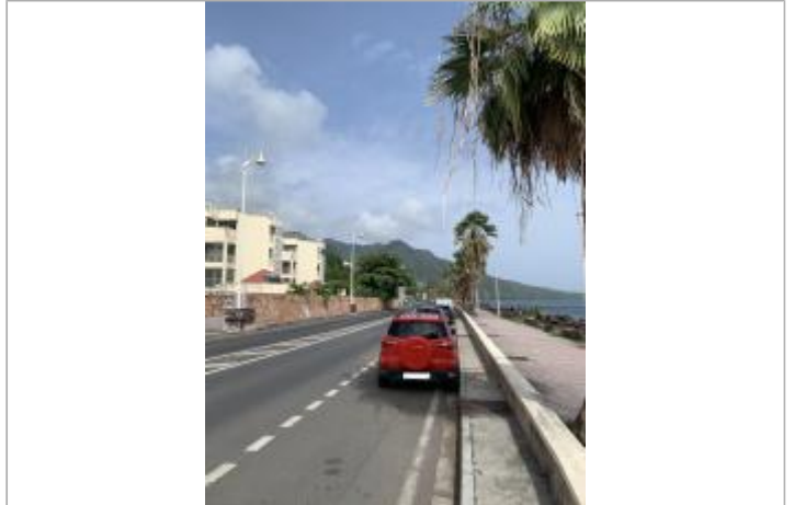
Vue d'ensemble de la zone inondée