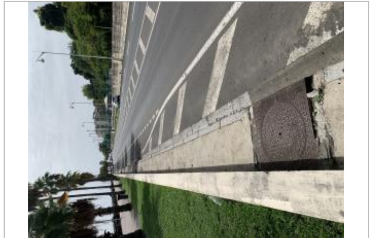
Vue d'ensemble de l'emprise de zone inondée