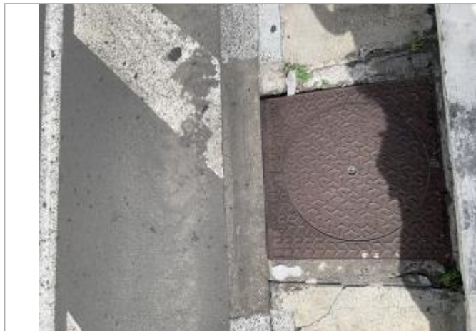
Emprise de la zone inondée au niveau de la bouche d'égout