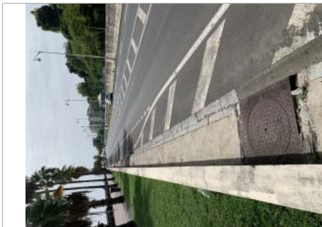
Vue d'ensemble de l'emprise de zone inondée