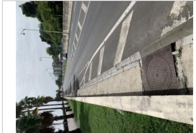
Vue d'ensemble de l'emprise de zone inondée