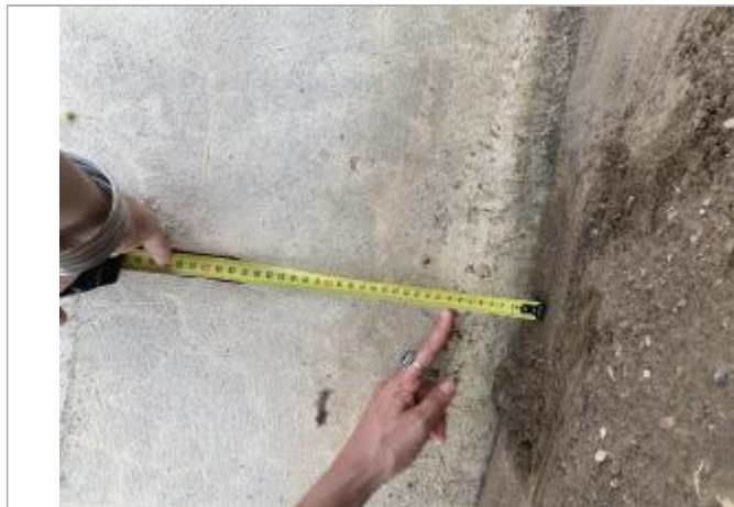
Dépôt de matières solides