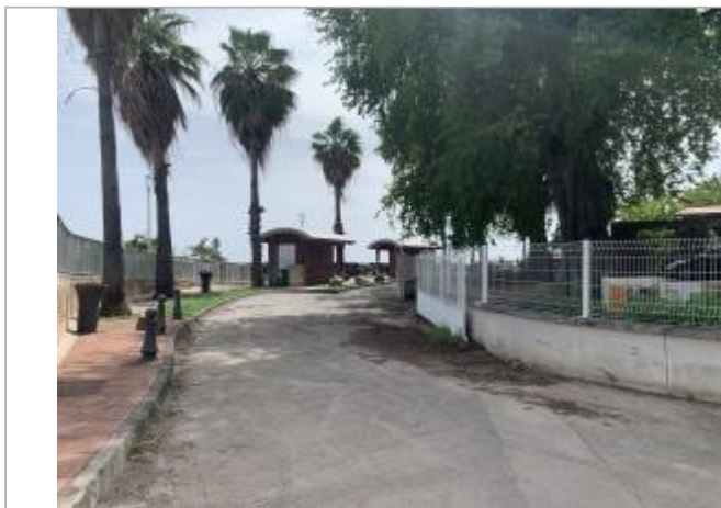
Muret de clôture blanc