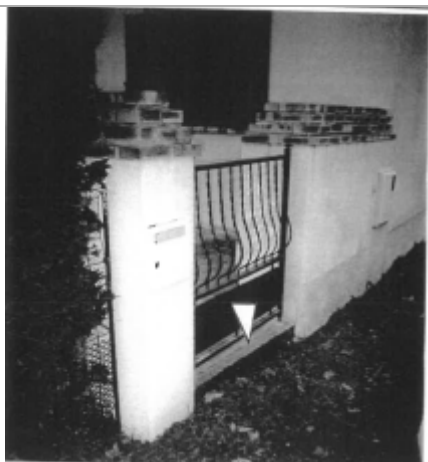
+0.05 m seuil béton portillon coté rue

Altitude calculée de l'eau (en m) : 60.2 m