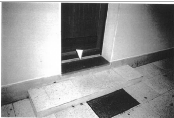
+0.10 m seuil rouge de la porte d'entrée