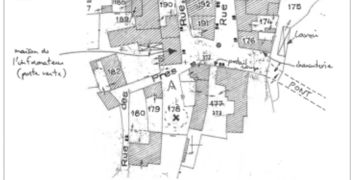
plan du site