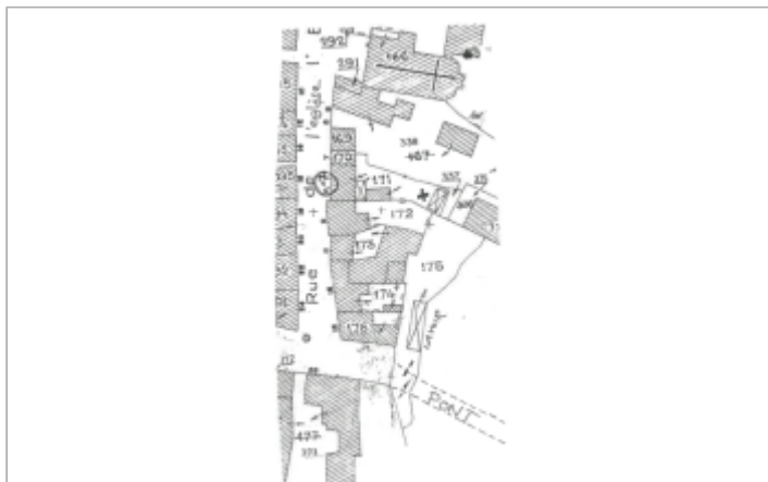
plan du site