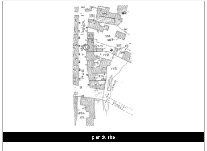
plan du site