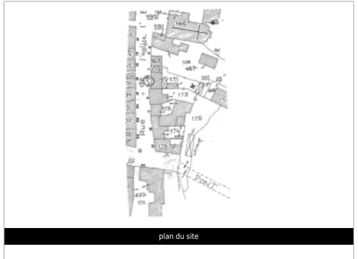
plan du site