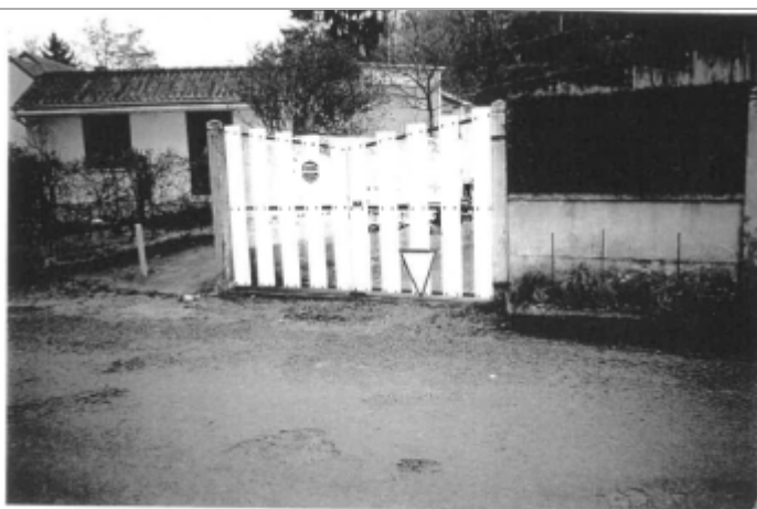
+0.15 m seuille béton entrée

Altitude calculée de l'eau (en m) : 65.12 m