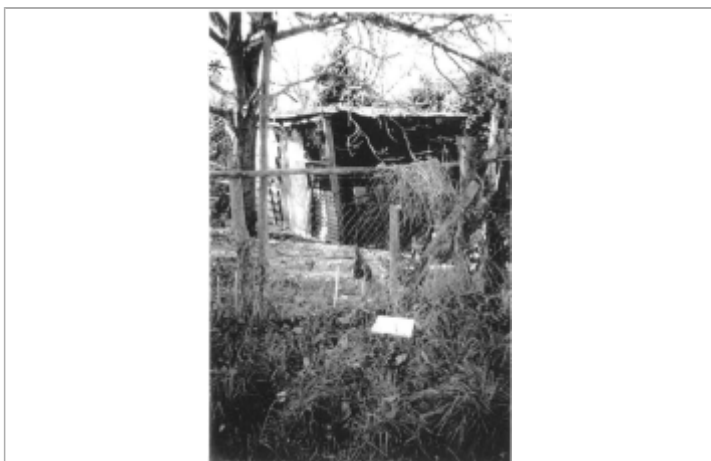
+0.00 TN ( au pied du piquet)