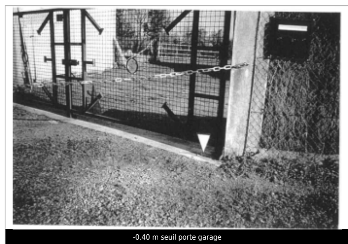
-0.40 m seuil porte garage