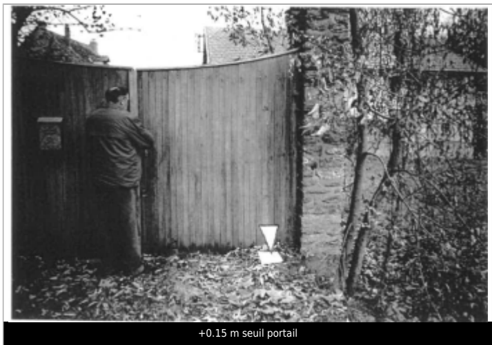
+0.15 m seuil portail