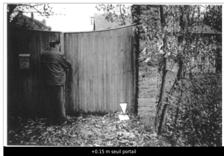
+0.15 m seuil portail