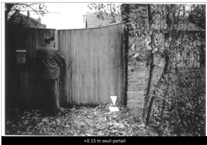
+0.15 m seuil portail