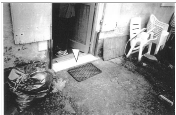
-0.02m par rapport au seuil de la porte