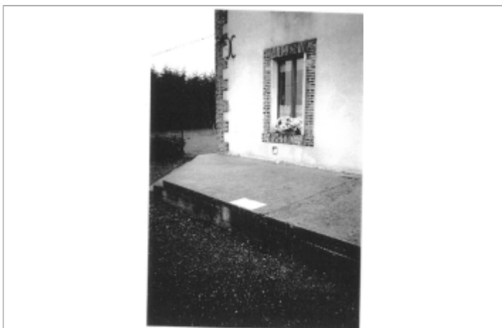
même hauteur que la dalle de béton