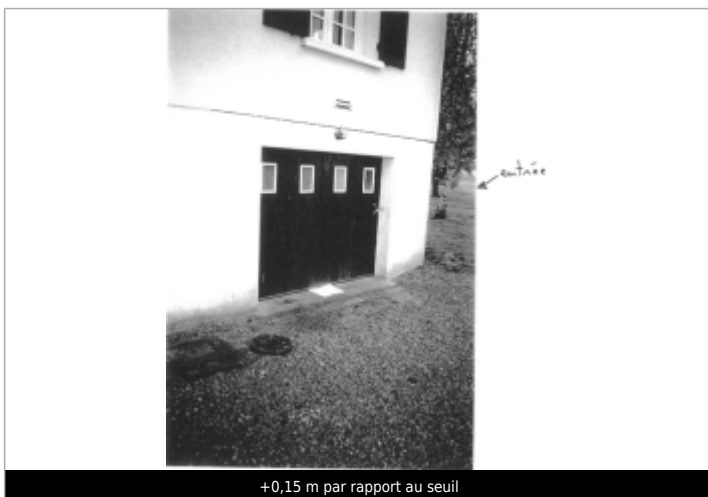
+0,15 m par rapport au seuil