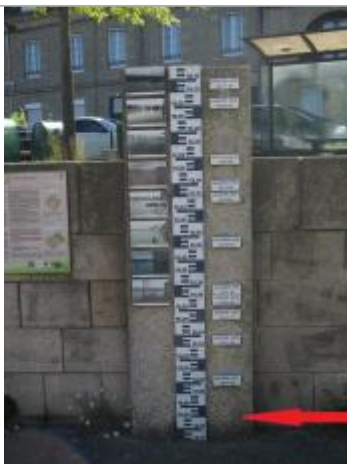
report du niveau de l'inondation sur le totem des repères de crues, quai Niemen

Altitude calculée de l'eau (en m) : 54.8 m