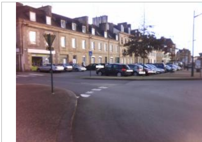
VUE D'ENSEMBLE ROND POINT PLACE NIEMEN

Coordonnées WGS84 : X: -2.96825010 / Y: 48.06708070