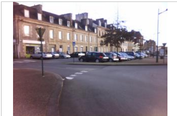
VUE D'ENSEMBLE ROND POINT PLACE NIEMEN