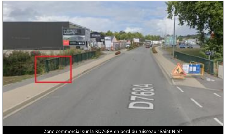
Zone commercial sur la RD768A en bord du ruisseau "Saint-Niel"

Coordonnées WGS84 : X: -2.96055922 / Y: 48.04296130