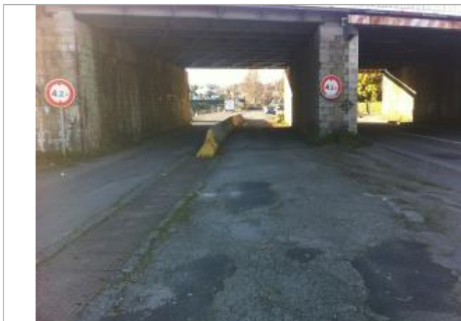
Vue d'ensemble du pont côté aval

Coordonnées WGS84 : X: -2.96672080 / Y: 48.05858800