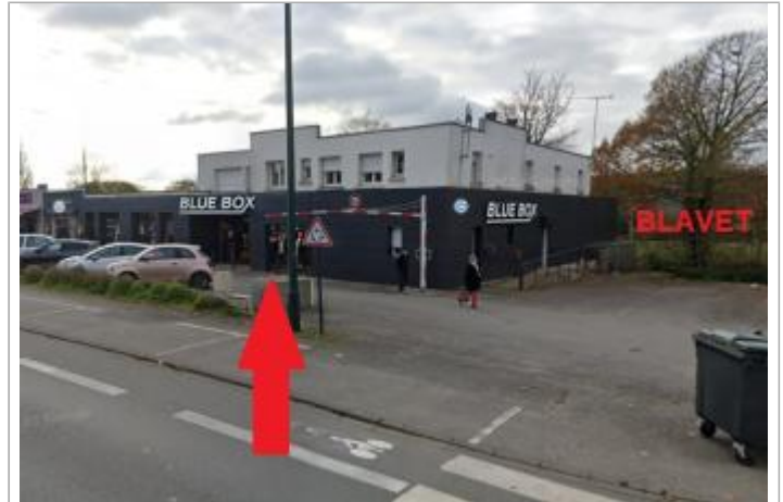
Parking devant le magasin au 61 rue Albert de Mun

Coordonnées WGS84 : X: -2.95961635 / Y: 48.05248590